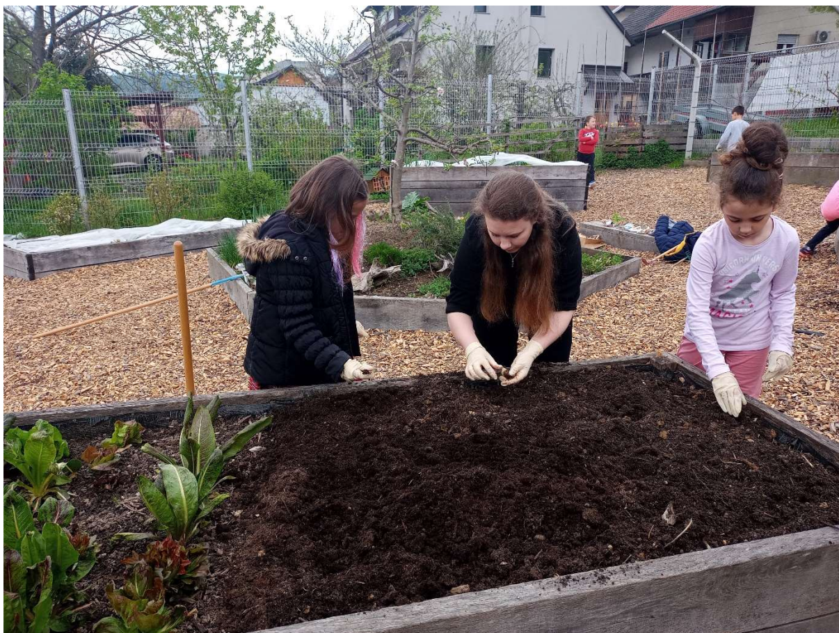
UČENCI 1. IN 2. R