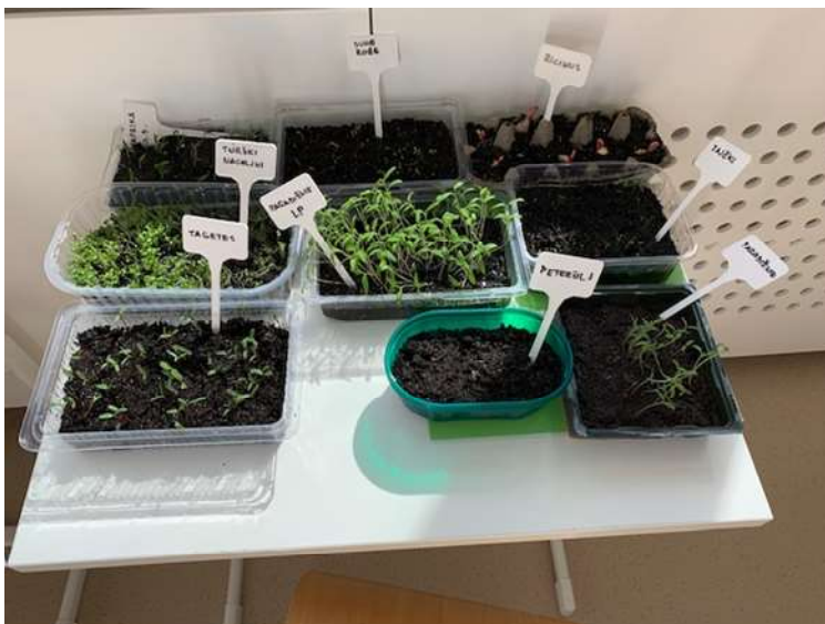
DIANA CERAR, PPVI 2