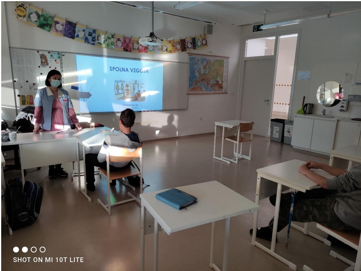
Učenci 8. in 9. razreda NIS

OPOZORILA NAS JE NA RAZLIKE MED FANTI IN PUNCAMI. NAJBOLJ PA JE POUДАРILA VZGOJO ZA ZDRAVO SPOLNOST. PREDSTAVILA NAM JE RAZLIČNE SPOLNO PRENOSLJIVE BOLEZNI IN NAČINE, KAKO SE PRED NJIMI ZAŠČITITI. ČEPRAV NAS JE BILO MALO SRAM IN NAM JE BILO SMEŠNO, SMO SE VELIKO NAUČILI. MEDICINSKI SESTRI SE ZAHVALJUJEMO ZA ZANIMIVO PREDAVANJE.